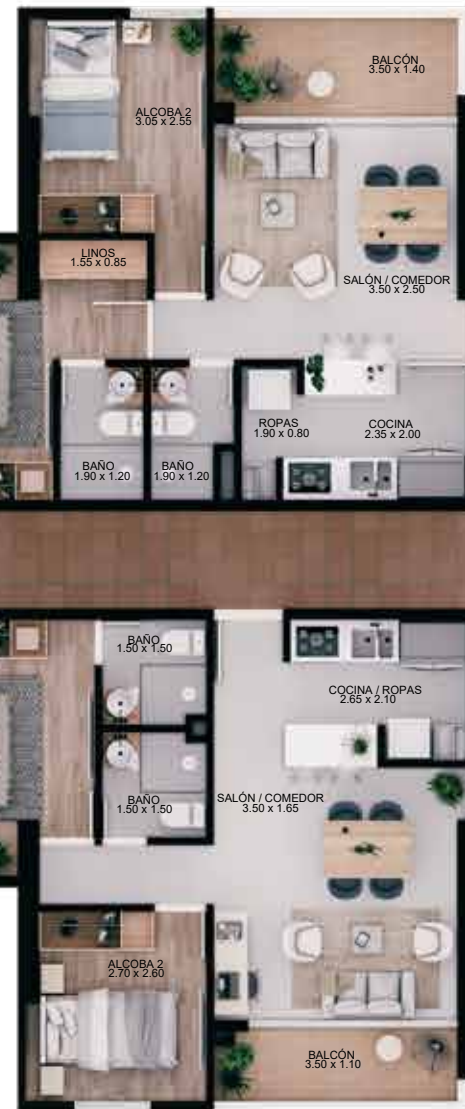
APTO TIPO J Área construída 55.71 m 2 Área privada 50.02 m 2