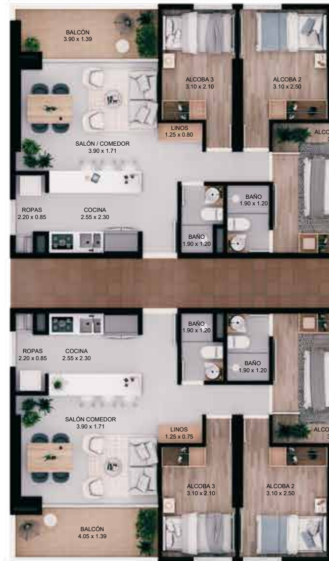
APTO TIPO I Área construída 70.45 m 2 Área privada 63.46 m 2