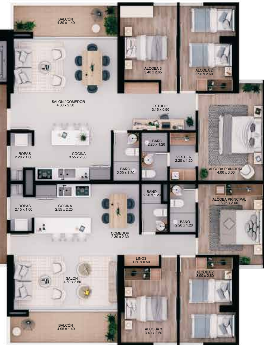
APTO TIPO K Área construída 84.88 m 2 Área privada 77.28 m 2